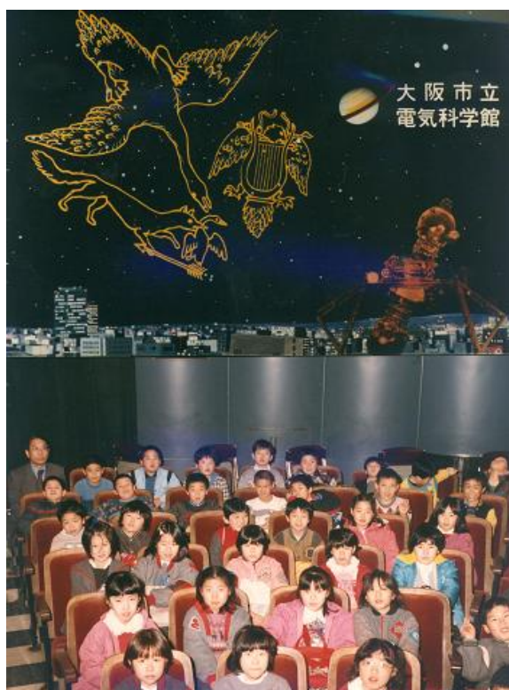
「昭和 60 年（1985 年）頃、担任をしていた大阪市立岸里小学校 3 年生を連れて行きました」