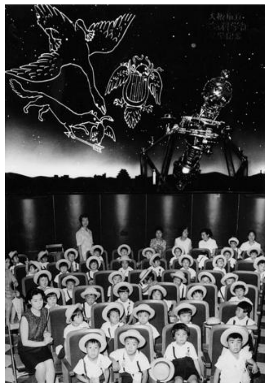
昭和 42 年（1967 年）、大阪市阿倍野区鶴が丘幼稚園 さつき組