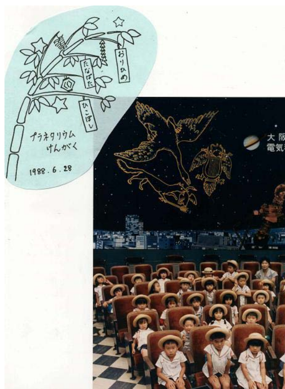
昭和 63 年、箕面自由学園幼稚園ゆり組 「園長先生が年長組園児を連れて行くのをとても嬉しそうに、そしてちょっと誇らしげに話されていました」