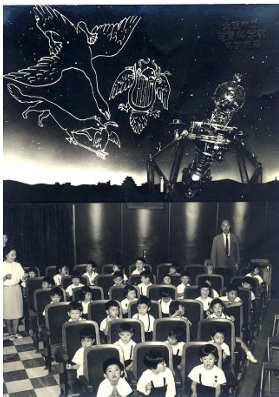
昭和 42、3 年（1967、8 年）頃、大阪市住吉区大領小学校 1、2 年生