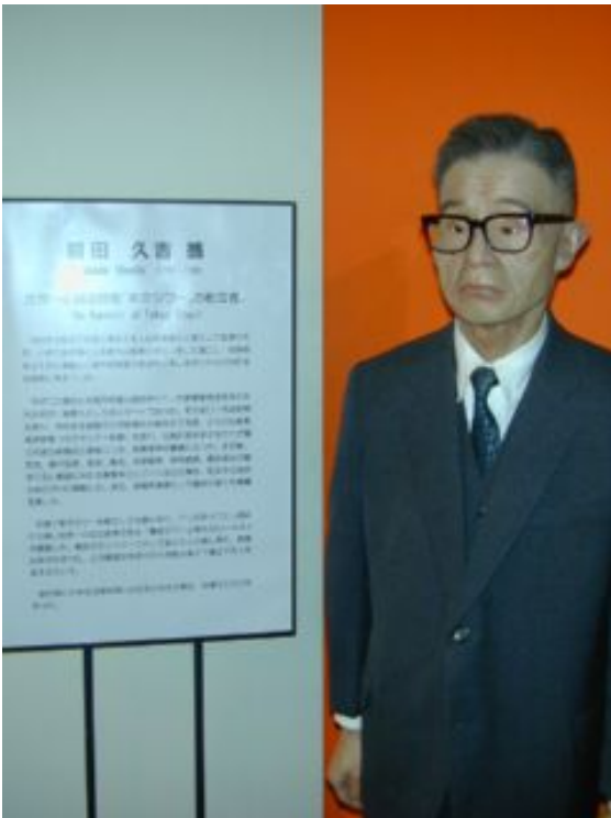
写真 6. 前田久吉。東京タワーの蠟人形。

がる時事新報社の経済的困難さも知っていたし、前田と頻りに交流していた。こうしたルートによって、前田が大阪市や阪急や近鉄のプラネタリウム設置計画をいち早くつかんでいたことは容易に想像できる。