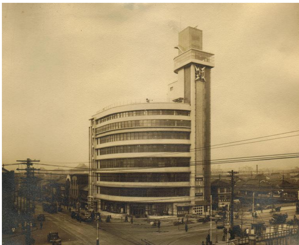
写真1. 開館時の電気科学館。南西から望む

電気局はたたみかけるように次に常設の宣伝館を計画し、1930年(昭和5年)4月、電気普及館を局舎内にオープンさせた。欧米諸国では「電気事業者又は製造業者の多くは、競って照明学校や陳列所を開き」、「需用者に電気智識を注入して、其の福利増進惹いては事業者の便益を圖りつ々ある」(電気普及館案内パンフより)ので、これに倣って電気普及館を開設したのであった。