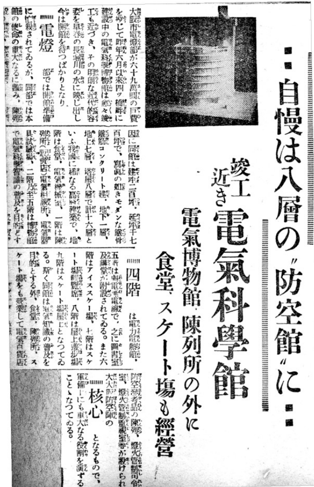
写真2. 一次案を伝える大阪日々新聞。 1935年3月22日号