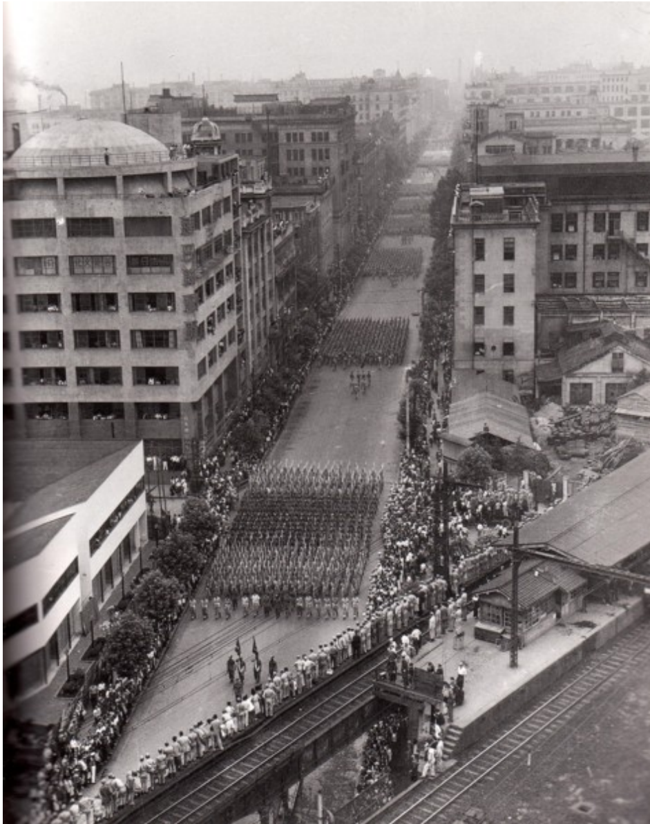
写真 5. 東日会館。右下は有楽町駅。6～8 階が天文館で、空襲で器械は焼けたが建物は残り、戦後、ホールは TBS ラジオのスタジオとして使われた。行進しているのは GHQ。1947 年。