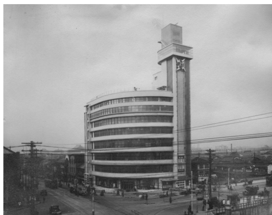
図1 大阪市立電気科学館（開館当時）

今から80年ほど前、大正デモクラシーの雰囲気が残る大阪は商工業都市、金融都市として成長し、大動脈の御堂筋の開通、地下鉄の敷設といった大型公共事業が進められる一方、大阪城再建から美術館の創設と、文化事業も育っていった。その流れの最後に乗っていたのが地方自治体最初の理工系博物館の建設、すなわち大阪市立電気科学館の建設計画であった。